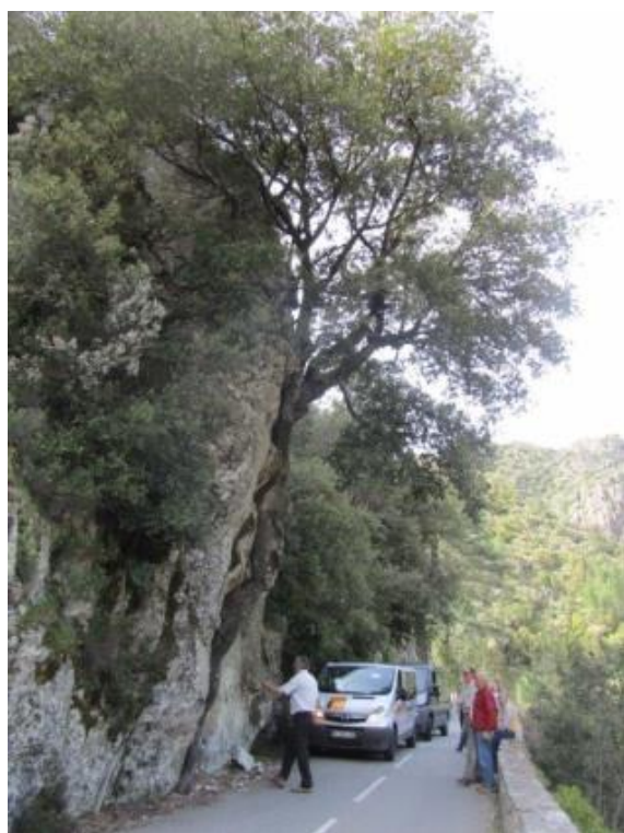
אלון שעם בקורסיקה, צומח מתוך הסלע