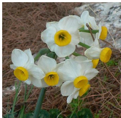
צא לנוף אך אל תקטוף

מערכת של בריכות ומפלי מים וגדלים בו עצי ארץ ישראל: מילה סורית, כליל החורש, אורן ירושלים, אלה אטלנטית, מיש דרומי, דולב מזרחי ועוד.