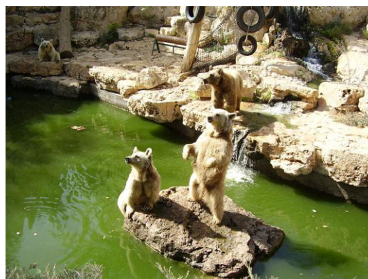
גן החיות התנ"כי – וגר זאב עם כבש ונמר עם גדי ירביץ

לגדל בגינה צמחי בר – ישראל היא מדינה קטנה, אך גדלים בה מעל 2,800 מינים של פרחי בר, מספר גבוה של ביחס לגודלה. במדינות רבות בעולם מתפתחת מגמה לעשות שימוש בצמחי בר לגינון. יתרונם הגדול של צמחי הבר הוא התאמתם לאקלים המקומי, בישראל משמע הדבר כי הם צמחים חסכוניים במים. אולם חלק גדול מפרחי הבר היפים והצבעוניים הם צמחים מוגנים – קיים חוק האוסר לקטוף פרחים, לאסוף זרעים או להוציא פקעות ובצלים. התקנה תקפה גם לגבי שטחים של שמורות טבע בהם אסור לפגוע בכל הצמחים.