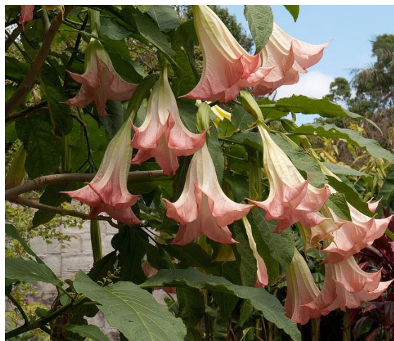
ברוגמנסיה 'אינסיגניס x פינק'

הכנת גלידה ביתית מזינה עם ילדים – אין כמו גלידה איכותית להפגת השרב במיוחד בשעות הערב. עם גלידה ביתית התענוג מתוק שבעתיים. גם אם אין לכם מכונת גלידה המתכון פשוט וקל וההצלחה מובטחת.