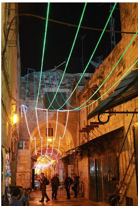
ראמאדן ברובע המוסלמי בירושלים

לטייל בגן בוני החומה – בחודש הרמאדן ירושלים היא "המקום" וגן בוני החומה מומלץ להתבוננות ולהרהורים. גן הבונים מצוי למרגלות חומת העיר העתיקה בין שער יפו לשער ציון. הגן משתרע על שטח של כשמונה דונם ויש בו שרידים של החומות מתקופות שונות, החל מחומת חזקיהו שנבנתה בתקופת בית ראשון וכלה בתקופה העותמאנית. אפשר ערוך סיור קצרצר בשבילי הגן ואבל בעיקר כדאי לשבת ולהתבונן.