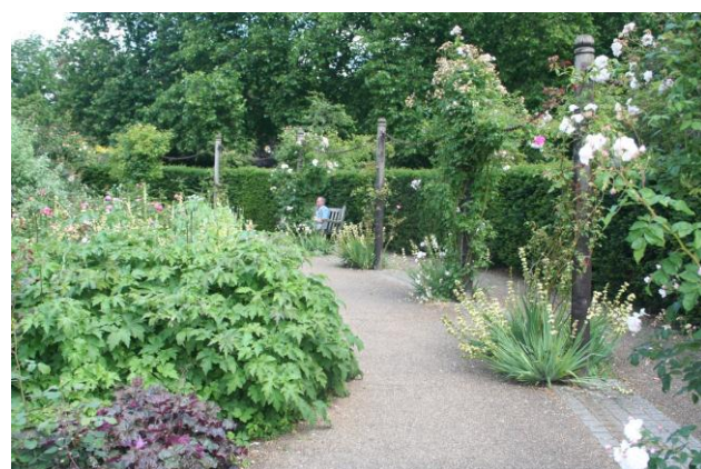
מה רבו נפלאותיך....

ללמוד על סימטריה עם ילדים - סימטריה היא תכונה של צורה. צורה היא סימטרית, אם אפשר להעתיק אותה על עצמה על ידי שיקוף, הזזה או סיבוב. במשחק נלמד את הילדים מהי סימטריה שיקוף (סימטריה ראי), כלומר סימטריה בעלת ציר סימטריה יחיד. אם נעביר קו דמיוני שחוצה את האובייקט לאורכו ונשקף את תמונתו סביב אותו קו דמיוני, המכונה קו הסימטריה- התמונה לא תשתנה .