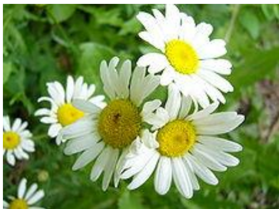
חרצית, פרח לב הזהב....

את תחרויות איש הברזל. רוצו לראות, הפארק פתוח מחמש בבוקר עד 12 בלילה.