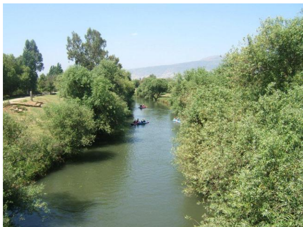
ירדן זורם שקט כמו חלום...