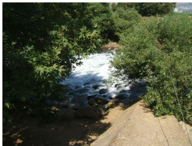
מבט מהטיילת, הירדן נגלה ונסתר חליפות

את הרכב כדאי להחנות בחניון החרובים השופע בחורף פריחה של רקפות ושאר צמחי בצל ופקעת. המסלול נינוח, אורכו כ-800 מטרים והוא מותאם לעגלות ולכיסאות גלגלים. הנחל הזורם תדיר ועצי הערבה והאולמוס המצלים על השביל הופכים את המקום לכדאי לביקור כל ימות השנה. בחורף כשערפילים מכסים את הנחל, העצים עוטים שלכת צהבהבה ומבין הסלעים מבצבצים טחבים ירקרקים, יש תחושה של מקומות זרים ורחוקים. בקצה המסלול מצוי עין חשרת (עין אמי), אחד מן המעיינות המזינים את הנחל. המים נובעים מנקבות חצובות בסלע ונקווים אל בריכה רבועה. מנקודת הסיום ניתן לשוב בדרך עפר נוחה לחניון החרובים.