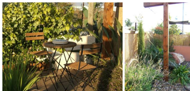
הכל זורם: רוח ומים

תורת הפנג שואי עוזרת לנו להפוך את המרחב בו אנו נמצאים – כולל הגינה – למקום שנעים יותר לגור בו, מקום שגם מקדם את שאיפותינו. אין סטירה בין יישום פנג שוי לתכנון רגיל של הגינה, יישום הפנג שואי בגן מעניק עומק ומשמעות כדרך חיים ולא כסגנון. תכנון ועיצוב הגן ייעשה בפשטות, בהתאם לאופי האזור מבחינת אקלים, נוף וצמחייה, תוך שמירה על אלמנטים טבעיים. על מנת ליצור אווירה הרמונית ונעימה לשהים בגן, מושם דגש על זרימה של קווים רכים ומעוגלים, התורמים לרוגע ולתחושה זורמת. כן נעשה שימוש בפתחים ובחלונות הפונים לנוף יוצרים תחושה של הרחבת גבולות הגן.