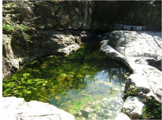
מעיין נבוריה ביער ביריה מבעבע כל ימות השנה

ליער שלש כניסות עיקריות: 1. מכביש 886 דרומית למושב דלתון פונים מזרחה ליער. 2. מכביש 90, 100 מטר צפונית לצומת מחניים פונים מערבה ליער, לסביבת עמוקה. 3. מול הכניסה הצפונית של צפת מתפצל כביש 8900. ההסתעפות המזרחית מוליכה צפונה ליער, למצודת ביריה.