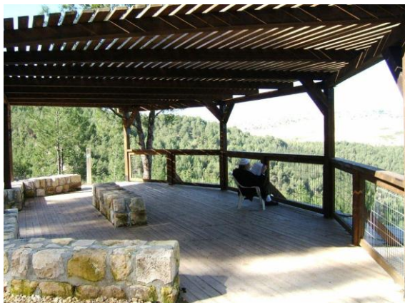
מנוחה אל מול הנוף המדהים

נטייל ליער ביריה - על רכסים וגאיות מתפרס יער ביריה, יער נטע אדם הגדול בגליל. הפסגות נישאות לגובה של יותר מ-900 מטר והאוויר נעים וקריר גם בימות החמה. היער צופן בחובו אתרים היסטוריים, בוסתנים, מצפורים ומעינות השופעים מים כל ימות השנה, אך עיקר פרסומו בשל קברי צדיקים השוכנים בו. במעבה היער שוכן קברו של יונתן בן עוזיאל, שהרייטינג שלו נוסק לשמים, שכן השתטחות עליו היא סגולה לפריון וזיווג.