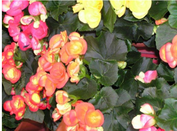
ביגונית הורד, מתאימה לגידול לעציץ בבית, משך חייה מגיע עד מספר שבועות בלבד...

ליער שלש כניסות עיקריות: 1. מכביש 886 דרומית למושב דלתון פונים מזרחה ליער. 2. מכביש 90, 100 מטר צפונית לצומת מחניים פונים מערבה ליער, לסביבת עמוקה. 3. מול הכניסה הצפונית של צפת מתפצל כביש 8900. ההסתעפות המזרחית מוליכה צפונה ליער, למצודת ביריה.