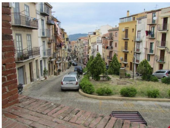
קסטלבואנו, מבט מהמבצר

מרחק של כחצי שעה נסיעה מצ'פלו מצוי במרכזו של פארק טבע בינות להרים כפר קטן, קסטלבואנו שהוקם בשנת 1316. הכפר, הקרוי על שם המבצר המצוי במרכזו, שמור היטב עד לרמת ריצוף הרחוב. למרגלות המבצר יש בית קפה קטן וחביב עם מבחר אינסופי של עוגות ופטיפורים משובחים. כדאי לשבת לאתנחתא קלה לאחר סיבוב הליכה רגלי קצר בכפר.