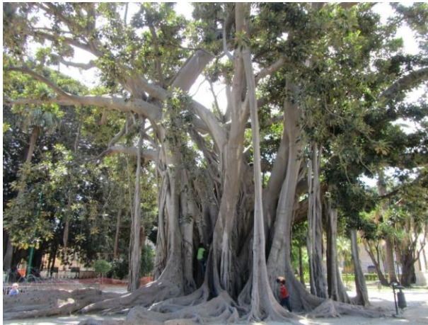
פיקוס המגנוליה הקשיש ביולה גריבלדי

יום סיור עם ילדים סמוך לפלרמו – מרחק נסיעה של שעה קלה מפלרמו מצויים שני כפרים ציוריים: צ'פלו השוכן ליד הים וקסטלבואנו הנחבא בהרים. המסלול אינו ארוך והוא חולף בנופים מגוונים החל מים תכול ועד להרים גבוהים המתכסים ביוני בפריחה נהדרת.