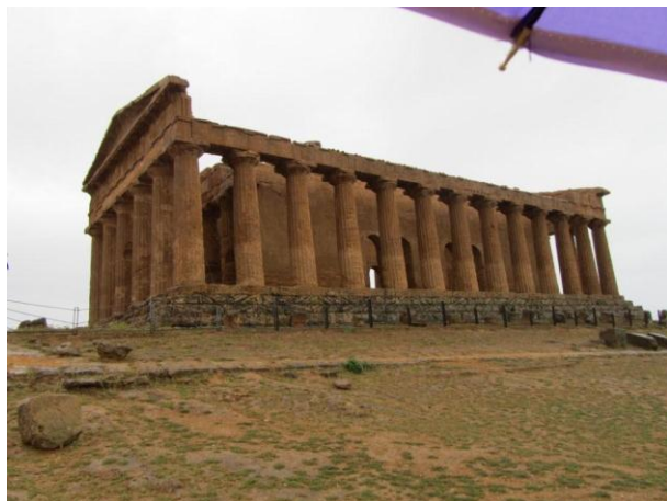
עמק המקדשים, המקדש המושלם בעולם...

ביקור בגן הבוטני של פלרמו – מקורותיו של הגן הבוטני בפלרמו נטועים הרחק בשנת 1779. האוניברסיטה של פלרמו הקימה קתדרה לרפואה, ובסמוך לו גן בוטני קטן, שמטרתו תרבות צמחים בעלי תועלת רפואית. במהלך השנים הלך הגן וגדל, וכיום הוא מתפרש על יותר מ- 10 הקטר.