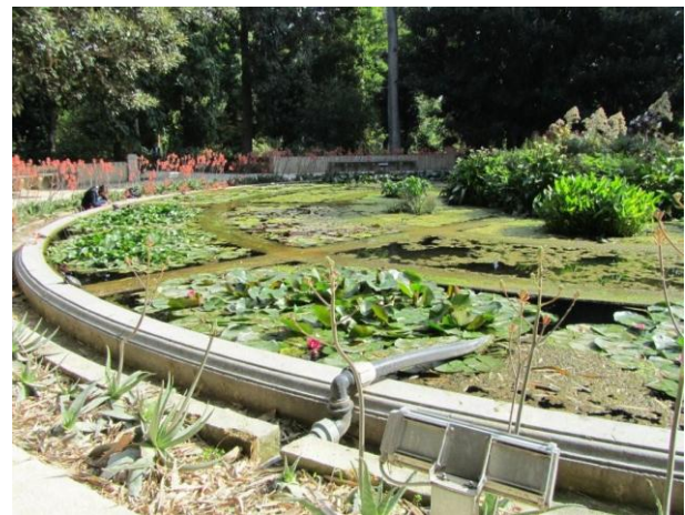
שבילים צרים ומוצלים ובריכת מים מופלאה בגן הבוטני של פלרמו

לגדל את פיקוס המגנוליה – אחד הצמחים יפים שנשתלו בגניה של פלרמו הוא פיקוס המגנוליה ( Ficus macrophylla ), עץ גדול ירוק עד ממשפחת התותיים, קרוב משפחה של התאנה, הגדל בר בחוף המזרחי של אוסטרליה. העץ יפה במיוחד כיוון שיש לו מערכת מרהיבה של שורשי אוויר, והוא נותן צל נהדר ונעים.