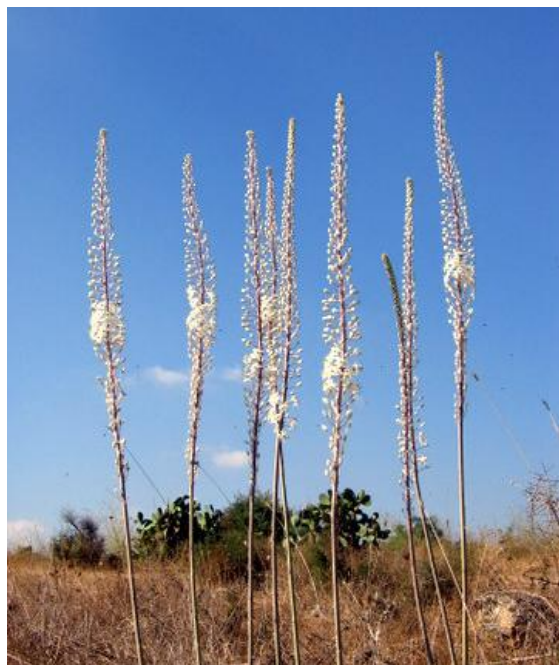
חצבים פורחים וצפרים אין ספור ...

ביקור בעינות גבתון - עינות גבתון היא פנינה נחבאת במרכז הארץ, שמגיעים אליה יודעי חן בלבד. זוהי שמורת טבע קטנה, שגודלה 80 דונם, ובה שתי קבוצות של נביעות בהן זורמים מים כל השנה וסביבן גדלים צמחי מים וביצה. לקראת סוף הקיץ יש שם פריחה נהדרת של צמחי מים וחצבים.