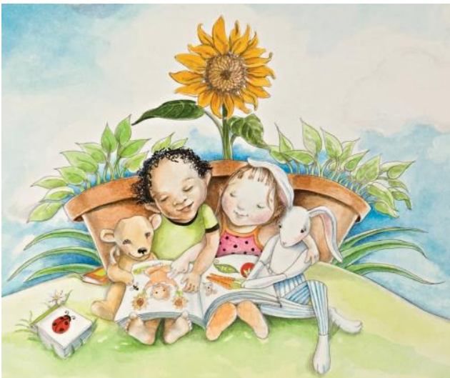
בערוגת הגינה מסביב לחבית עמדו לרקד כרוב עם כרובית...

קשה לכתוב על הלוטם מבלי לספר את האגדה הבאה: שר-היער הזמין את כל הפרחים למסיבה, וביניהם את שני האחים לבית לוטם. אחד מהם, שהיה חרוץ וקפדן, השכים קום, התגלח, היזה על עצמו בושם עדין, לבש חולצה לבנה מגוהצת והגיע לנשף במועד. אחיו העצלן קם ברגע האחרון, לא התגלח, לבש את החולצה הראשונה שהזדמנה לו, מקומטת ובלויה, ורץ אל המסיבה. בראותו את כל המוזמנים לבושים היטב, נקיים ומסודרים, ורק הוא פרוע – הסמיק מבושה. מאז יש ללוטם השעיר פרי בלתי מגולח, עלי כותרתו סמוקים ומקומטים, והוא חסר ריח; בעוד אחיו, הלוטם המרווני, אינו שעיר, עלי כותרתו לבנים ומגוהצים והוא מדיף ריח עדין.