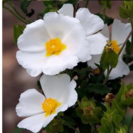
ורדרד ופריו שעיר (לוטם שעיר) אין מרווני ממנו (לוטם מרווני)

לגדל לוטם בגינה – אחד מצמחי הבר היפים של ארצנו הוא הלוטם. בארץ גדלים שני מינים: לוטם שעיר, שצבעו ורדרד ומרווני שצבעו לבן. יש המזהים את הלוטם עם הבושם הנקרא בתנ"ך בשם לוט: "והנה אורחת ישמעאלים באה מגלעד וגמליהם נושאים נְכָאת וְצִרִי וְלֹט הולכים להוריד מצרימה" (בראשית ל"ז, 25).