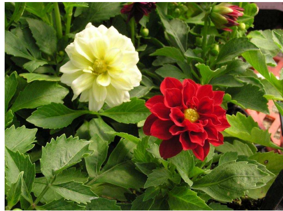
וכל השרות וההרינות פסעו לאט בתוך שדרת קזוארינות

המנדט שצמחייתו השתמרה להפליא, לרדת עד לבית הועד הישן, הממוקם ברחוב החלוץ, להמשיך ברחוב הגיא. וממנו לפנות ימינה לרחוב הבנאי. בקצה רחוב זה מצויות סמטאות קטנות וצרות הקרויות על שם בעלי מקצוע. רחוב החוצב, רחוב הסתת ורחוב הסוללים בהם עומדים על תילם בתים חד-קומתיים שנבנו בשנותיה הראשונות של השכונה.