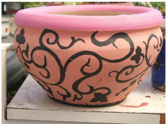
בשלל צבעים וצורות...

המנדט שצמחייתו השתמרה להפליא, לרדת עד לבית הועד הישן, הממוקם ברחוב החלוץ, להמשיך ברחוב הגיא. וממנו לפנות ימינה לרחוב הבנאי. בקצה רחוב זה מצויות סמטאות קטנות וצרות הקרויות על שם בעלי מקצוע. רחוב החוצב, רחוב הסתת ורחוב הסוללים בהם עומדים על תילם בתים חד-קומתיים שנבנו בשנותיה הראשונות של השכונה.