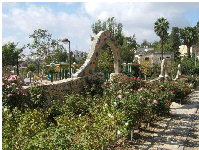
שכונת הפועלים שהפכה לשכונת יוקרה

סיור בבית הכרם שכונת הפועלים - בית הכרם, שכונת גנים, נבנתה בתקופת המנדט הבריטי (1922), מתוך האידיאל של לחיות בחיק הטבע ולהיות קרוב אל האדמה. השכונה מככבת בספריהם של עמוס עוז, מאיר שלו וגם של דוד גרוסמן. מקימיה היו מורים, סופרים ופקידים, שרכשו בה חלקות אדמה והקימו בה בתים. סביר להניח שכיום אין ביכולתם של העוסקים במקצועות אלו לקנות דירה בשכונה, שהפכה לאחת מהיקרות בירושלים. אופיה הפסטורלי עדיין נשמר שכן נותרו בה בתים חד קומתיים ציוריים, והרחובות עמוסי צמחיה ומוצלים. שני הרחובות המרכזיים הם רחוב בית הכרם ורחוב החלוץ, המתעקלים כשבילים בגן אנגלי. רחובות אלה מחוברים ביניהם במספר גרמי מדרגות מוצלים ונעימים להליכה, כרחוב סילמן או רחוב הברושים.