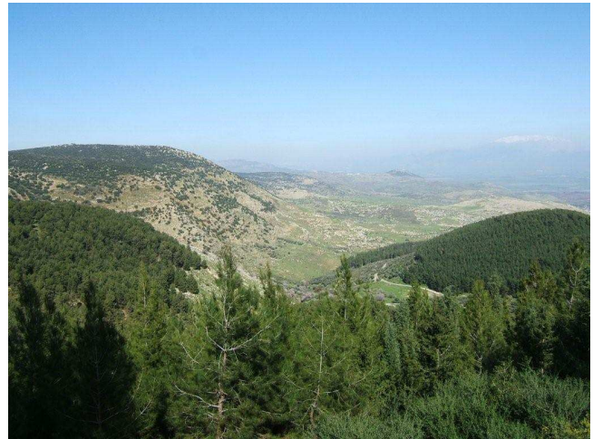
נופי יער ביריה

הכניסה הצפונית (הראשית) לצפת, מתפצל כביש המוליך צפונה, היישר לתוך היער ומצודת ביריה.