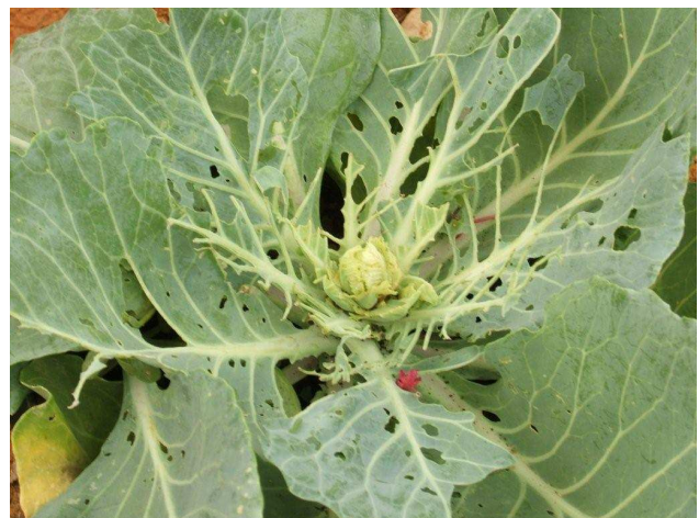
מי ערך ביקור אצל הכרוב?

יש דרכים רבות להתגבר על מזיקי הגן ומחלותיו, הדרך הפשוטה, הקלה והזולה ביותר היא מניעה. צמחים כדאי לקנות רק במשתלה טובה (איכותם של הצמחים שמוכרים בסופר למשל ירודה למדי). צמחים המטופלים היטב יינזקו פחות על ידי מזיקים ופטריות. כלומר יש לתת לכל צמח את התנאים המתאימים לו: השקיה (לא בעודף) ועוצמת הארה. כדאי מאוד לעקוב אחר גינת השכנים, מה שמצליח שם אמצו לגינתכם. מומלץ לעקוב אחר הגינה באופן יומיומי, במידה ומתגלה צמח נגוע, יש להרחיקו ללא רחמים מן הגן. עציץ יש להעביר למקום מבודד ואילו צמח השתול באדמה כדאי פשוט לעקור. ולא השתמשנו בתכשירים אורגניים פשוטים תוצרת בית....עליהם בפעם אחרת.