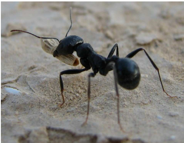
לך לנמלה עצל....

ראשית הכינו את הקופסא לחרק. שימו בה מעט אדמה והוסיפו אבן או שתיים. בגינה עזרו לילדים לחפש חרקים, הם אוהבים להסתתר בצל הזיזו אבנים ובדקו מתחת לצמחים. הרימו את החרק בפינצטה (לא ביד) והכניסו לקופסא. השתמשו בזכוכית מגדלת להתבונן מה עושה החרק (ג'וק בשפה הפופולארית). כמה רגליים יש לו? מהם צבעיו? האם מצוירת עליו דוגמא? איך הוא מגן על עצמו? עתה תוכלו לצייר אותו על הנייר. למרות שהחרק קטן בקשו מהילדים לציירו בגודל של לפחות 10 ס"מ. בסופו של דבר החזירו את החרק למקום בו מצאתם אותו. חרקים שסביר להניח שתמצאו: נמלים, צרצרים, פרפרים, חיפושיות, חגבים ועוד. במידה והילדים מעוניינים לזהות את החרקים כדאי להיעזר בספר: "מדריך החרקים בישראל" של פנחס אמיתי בהוצאת כתר.