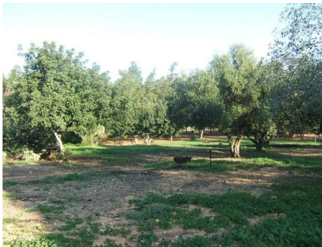
מצפה בן שמן לאור יום

אחת מן הפעילויות הללו היא בילוי בקמפינג עם לינת לילה. החוויה מאפשרת לילדים להיחשף לחיי הלילה של הטבע: להקשיב לרוח, לחוות צרצור צרצרים, להיות קרובים לאדמה ולהכיר את כוכבי השמים. בחלק מן הפארקים הלאומיים אפשר לנטות אוהל בתשלום וליהנות משירותים, מים וחשמל: גן לאומי עין חמד, גן לאומי אשקלון פארק מקורות הירקון ועוד. אפשרות אחרת היא לתקוע יתד בחניוני קק"ל חנימיים הכוללים מים ושירותים אך נטולי חשמל. מקום נהדר לבילוי שכזה הוא יער החמישה, הסמוך לכניסה ליישוב הר אדר. יש שירותים ומים וכן תחושת בטחון בשל השמירה, קחו בחשבון שאוויר הלילה במקום קריר ונעים, כדאי להביא סוודר. אתרים נוספים עם מים ושירותים: חניון מצפה מודיעין ביער בן שמן, וחניון יער לביא הסמוך לצומת גולני.