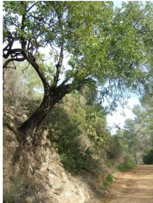
ממראות יער הקדושים ביום

ההתחלה של המסלול ממשיכים בכביש 395 ואחרי כ- 3.8 ק"מ, כקילומטר לפני הפניה למושב כסלון, לאחר שהדרך מבצעת עיקול חד פונים שמאלה לחניון קק"ל מכאן מתחיל הסיור. זוהי צומת של דרכי יער, לוקחים את דרך הכורכר המוליכה מערבה למערת בני ברית. ההליכה לאור ירח מלא מענגת ביותר.