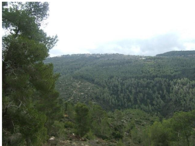
ממראות יער הקדושים לאור יום

סיור לילי ביער הקדושים – אחד המקומות הנעימים ביותר לטיול בתקופת הקיץ, ביום ובלילה, הוא יער הקדושים. היער שנטע בשנות ה-1950 לזכרם של ששת מליון קורבנות השואה, ממוקם על מורדות ההרים משני צדדיו של נחל כסלון. היער מצוי בלב הגן הלאומי הרי יהודה, בשל כך אין בו נטיעות חדשות ועצי חורש כאלון ואלה מתחדשים תחת עצי האורן.