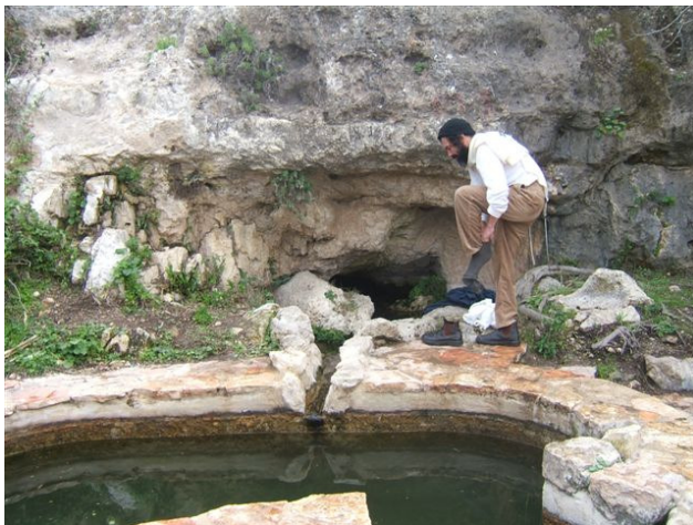
מעיינות שכבה סמוך לירושלים, לטבול בעין כסלון

ניתן להדגים את פעולתו של מעיין שכבה בעזרת בקבוק פלסטיק (קנקל) חתוך. יש לחתוך קנקל באמצעו ולמלא את חלקו התחתון באדמה אטימה למים לדוגמה חוואר מוצא, חרסית או חמרה (ניתן במקום להשתמש בקמח). על שכבה זו יש למלא שכבה נוספת של קרקע חדירה למים כמו חול או אדמה המתפתחת על סלעי גיר. בעזרת מסמר מחומם יש לנקב שני חורים (או יותר) בקנקל. אחד באמצע השכבה האטימה ואחד באמצע השכבה החדירה. כעת שופכים כוס מים לתוך הקנקל ועוקבים אחר תנועת המים. המים יחלחלו לאיטם יגיעו עד השכבה התחתונה ושם יעצרו. הם יצאו ביצורה מן החור העליון ואילו השכבה התחתונה תישאר יבשה.