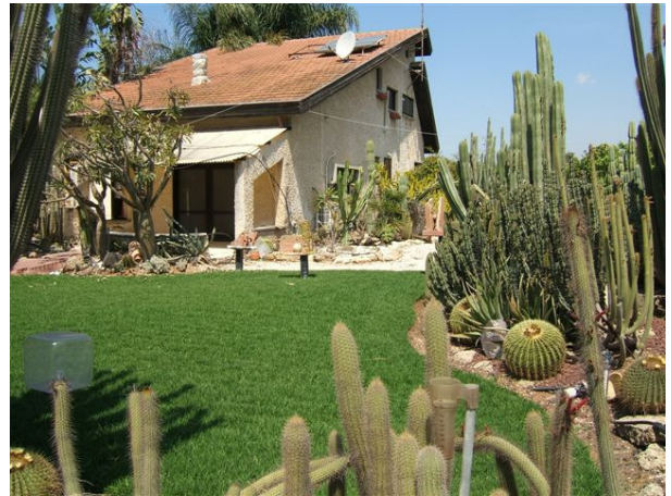
לא רק קקטוסים חסכניים במים

מספר מדרגות מובילות אל קרקעית בריכת האיגום, שעץ תאנה מטיל עליה את צילו. גובה המים בנקבות מותנה בעונת השנה, מומלץ להביא פנסים ובגד ים. ליד המעיין אין שולחנות וספסלים, אולם זהו מקום מקסים לפרוש שמיכה ולערוך פיקניק. במקום פחי אשפה ועל התחזוקה והניקיון מופקדים עובדי בית החולים הדסה עין כרם שאימצו את המקום.