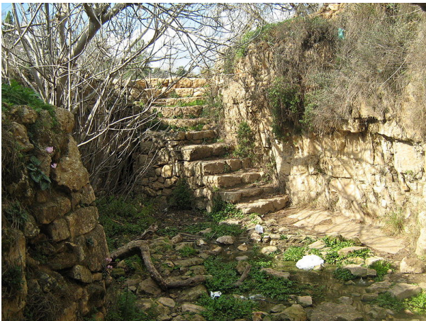
המדרגות היורדות אל בריכת האגירה

ביקור בעין חנדק – עין חנדק הוא מעיין שכבה מן היפים והגדולים שבמעיינות ירושלים הנובע כל ימות השנה. מיקומו בין מושב אבן ספיר לבית החולים הדסה עין כרם בירושלים. נוסעים לבית חולים הדסה עין כרם, סמוך לבית החולים פונים בכביש למושב אבן ספיר ונוסעים עד לשער הכניסה למושב. כאן מחנים את המכונית בשולי הדרך ויורדים בשביל המסומן כשביל ישראל עד למעיין, המוקף בבוסתנים עם עצי תאנה, זית ושקד.