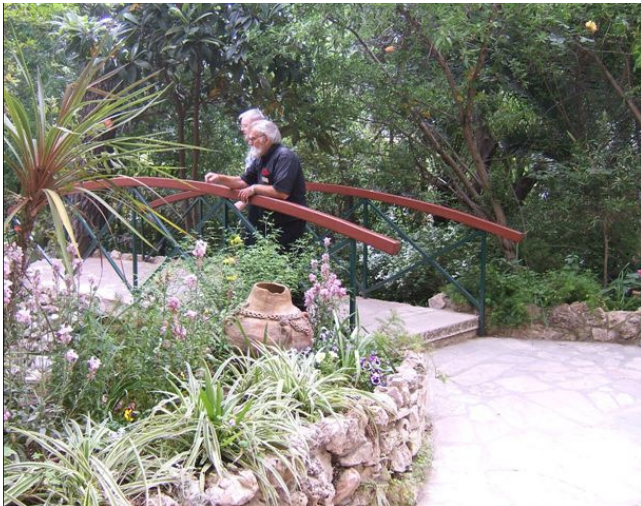
גן מקסים ומוצל כל עונות בשנה

גן הקבר בירושלים – ברחוב קונרד שיק בירושלים, סמוך לשער שכם שוכן גן הקבר. במקום זה, כך מאמינים הפרוטסטנטים, נקבר ישו ומכאן קם לתחייה בחג הפסחא. הביקור ללא תשלום בימים ב'–ש' בין השעות 9:00-12:00, ו- 14:00-17:30, טלפון 02-627727450. ניתן לחנות בסמוך ברחוב דרך שכם במגרש חניה הממוקם מול משרד הפנים.