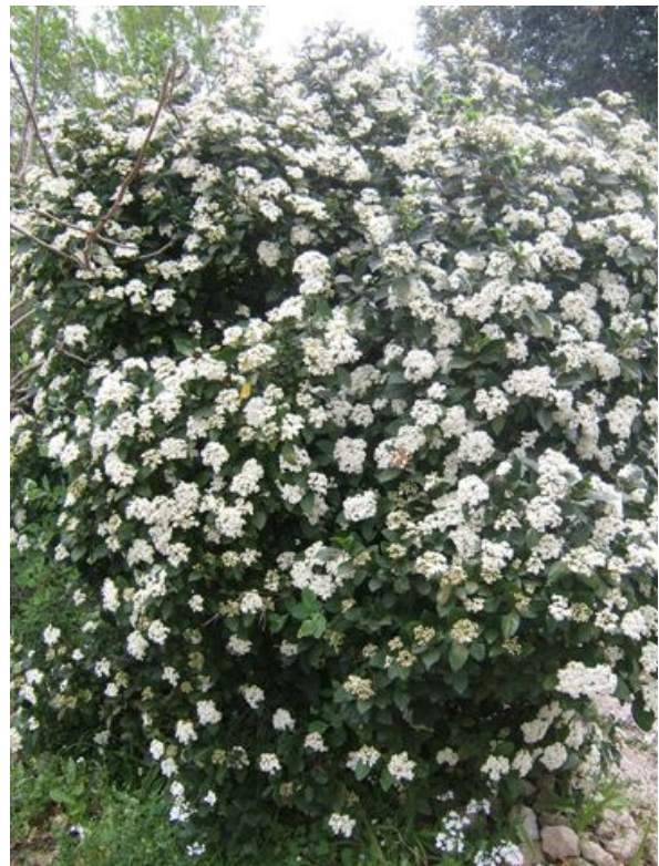
מורן החורש בפריחה לבנה

רבה בטיפוחו. אין בו דשאים, אך יש בו מינים רבים של עצים ושיחים. לא נדון בסוגיה מדוע הגן מזוהה על ידי הפרוטסטנטים כמקום קבורתו של ישו. מי שמעוניין יוכל להיכנס לאתר הגן http://www.gardentomb.com . נרמוז שהסיבה לכך היא שאין להם חלק בכנסיית הקבר... בגן מערת קבורה שתוארכה על ידי ארכיאולוגים לתקופת בית ראשון (מאות שנים לפני תקופתו של ישו). הפרוטסטנטים מאמינים כי זוהי המערה ששכנה בגנו של יוסף הרמתי תלמידו של ישו שבה נקבר. השנה חל יום התחייה של ישו בתאריך 12 באפריל, בשעות הבוקר המוקדמות ב - 6:30 מתמלא הגן מאמינים מזמרים, מחזה מרהיב עין. במקום שירותים נקיים וחנות מזכרות קטנה.