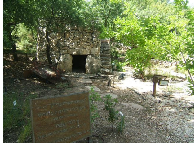
מבנה השומרה בגן הבוטני

לשבת ולהקשיב לפכפוף המים. כדאי גם כדאי לבקר במערת הקבר המצויה במרכז, זוהי אחוזת הקבר של משפחת ניקנור שתרמה את דלתות הנחושת לבית המקדש בתקופת הורדוס. כיום קבורים בה זה בצד זה מנחם אושיסקין ויהודה פינסקר מאבות הציונות.