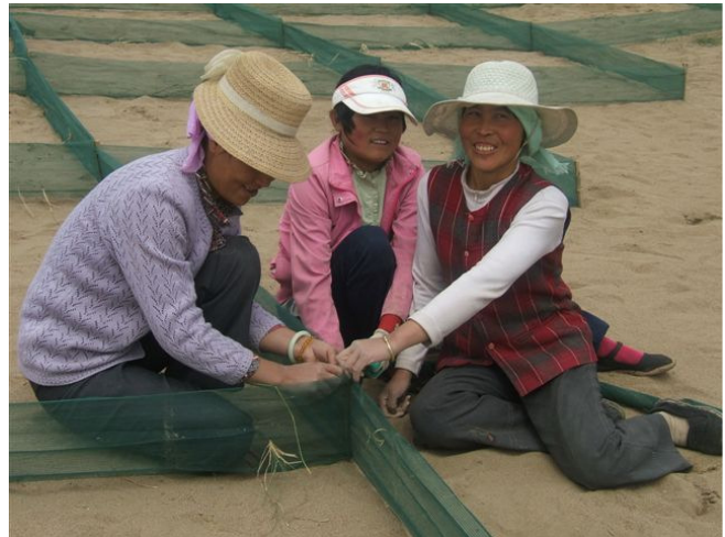
פועלות סיניות מכינות לנטיעה שטח חולי בגבול מדבר גובי

בניגוד לסין הנלחמת בחולות ושותלת צמחים לעצור את התפשטותם, בישראל נעשה הדבר בהצלחה יתירה ואזורי החולות החופיים יוצבו כבר בתחילת המאה שעברה. עם העלמות שטחי החולות נעלמו צמחיה ובעלי חיים ייחודיים האופייניים לאזור. אחד המקומות היחידים שנשארו בבתוליותם במרכז הארץ הוא חוף פלמחים. זהו מקום נפלא לשנירקול, שכן האזור הרדוד משופע ביצורים כמו סרטנים, דגיגונים, דיונונים וחלזונות. חובבי היבשה יוכלו ליהנות מאיסוף צדפים הפזורים על החול ומצומח ייחודי כחבצלת החוף, לוטוס מכסיף ועוד.