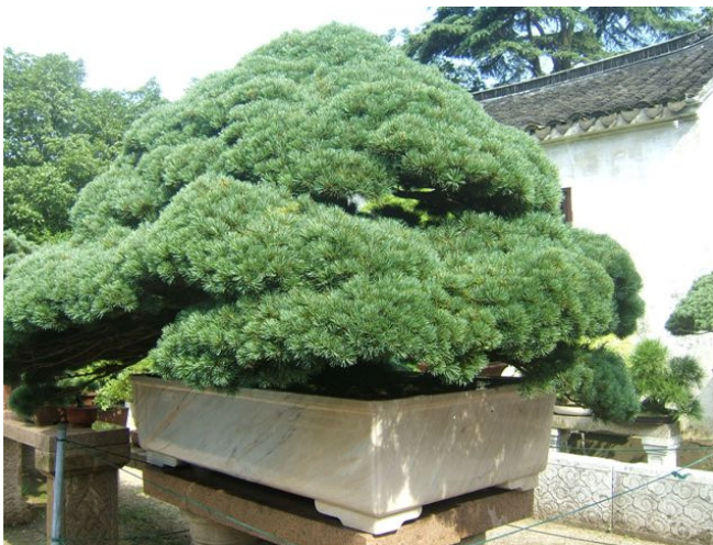
בונסאי ב - Administratog Garden בעיר Suzhou שבסין, מחירו לא יסולא בפז

להתבונן ולאכול אננס עם ילדים - אננס הוא צמח עשבוני קטן (ביהדות מברכים עליו בורא פרי האדמה), שמקורו בדרום אמריקה. קולומבוס הביא את האננס לאירופה ומשם על ידי הספרדים והפורטוגזים הוא הגיע למזרח אסיה. הוא נחשב בטעות לאחת מיסודות המטבח הסיני אך במציאות לא כך הוא.