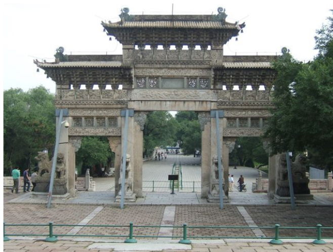
Huangshan, פארק ביילין, כניסה לקבר שהוכרז כאתר מורשת עולם על ידי יונסקו

ביקור בחוף פלמחים (חוף הדייגים והצוללים) – מגיעים לחוף פלמחים מכביש 4 ממנו פונים מערבה לכביש 4311. בסוף הכביש עומדים בעונת הרחצה גזלני המועצה האזורית שורק הגובים דמי כניסה של 20 שקלים למכונית. ניתן להחנות את המכונית לפני המחסום וללכת ברגל עד החוף מרחק 15 דקות הליכה. המשלמים את המחיר שנקבע נכנסים למתחם נוסעים כ- 300 מטר ואז פונים ימינה לדרך עבירה לכל רכב עד שמגיעים לחוף. בקרוב אמור להבנות על החוף כפר נופש. האתר להצלת חוף פלמחים- http://www.savepalmahim.org