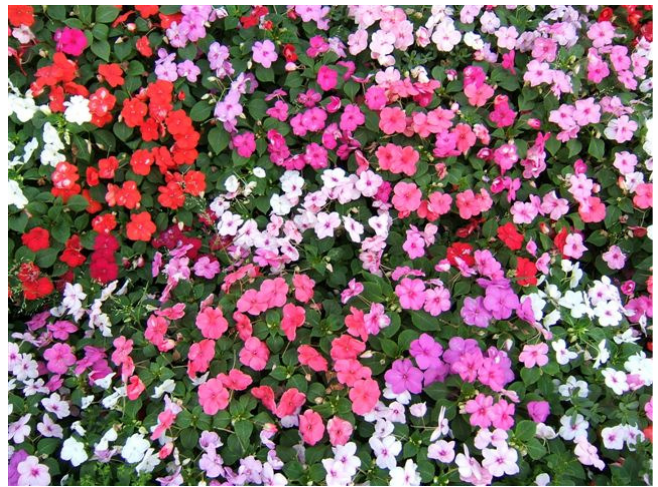
בשמת בשלל צבעים

אמנם אין זו שיאה של עונת הפריחה, אך אלוני התבור מתכסים בתקופה זו בפלומת עלים רעננה וירקרקת. השמורה היא מקום מוצל נהדר לפיקניק, להליכה קלה ברגל ולטיפוס על עצים. ביער מסלול טיול מעגלי ומשולט להולכי רגל שאורכו כ- 1 ק"מ, כחצי שעה של הליכה נינוחה.