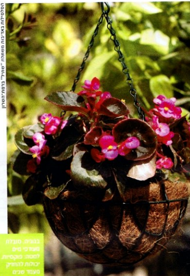
בצילום: חגית מילר מאפיין מרכזי לחיים: פוקסיות יכולות לחזיק מעמד שנים

יש המון מינים פורחים המתאימים לסלים כאלה. אפשר לשתול צמחים עונתיים או שנתיים. צמחים המתאימים לשהיה בצל א כשמש – תלוי היכן אתם מעוניינים למקם את העציץ הפריח. הפוקסיות שצינתי קורם לכן (ווי) יותר ממאה מינים) מועדפות על, מאחר שניתן לגדלן בבית וגם מחוצה לו. הן זקוקות לאור אך לא לקרינה תמיד ההצלחה מובטחת. חתרת הגידול שלהן הוא שכן אינו עונתיית. ולכן יכולות לחזיק מעמד מספר שנים, ויהי הן פריחה מהימה, בנוונים ודור, סגור, לבן ואדום. גם הגניונים הפורח סגלל צבעים