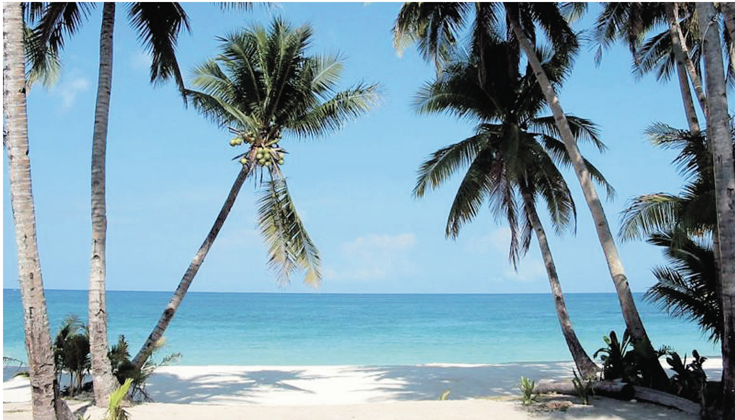
יש למשל את האופציה הטרונית. דקלים על חוף ים בפיליפינים

עץ דקל הוא הדבר הכי קרוב לגן עדן שאתם יכולים לסדר לעצמכם בחצר. אם אתם חיים באזור חם הוא גם יוכל להמטיר עליכם פירות קוקוס ותמר ← ד"ר ענת מדמוני