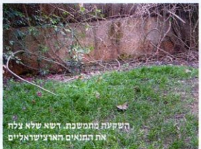
השקעה בתחנת. דשא שלא צלח את התנאים הארצישראלים